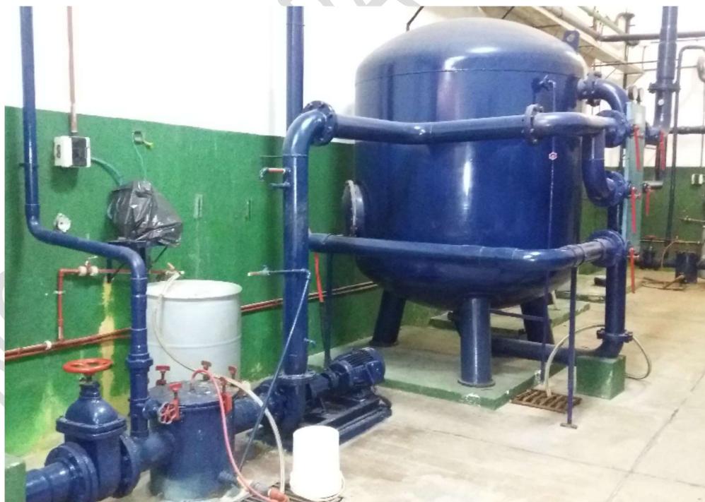
FILTROS DE PILETA DE NADADORES