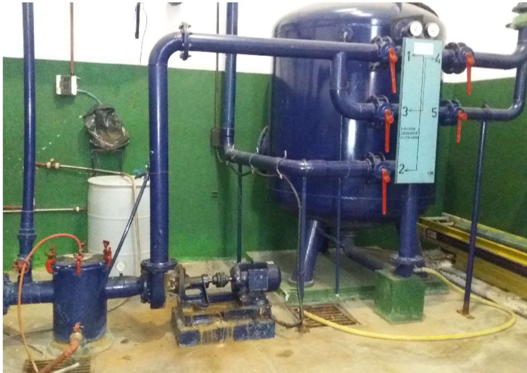
FILTRO DE PILETA DE NO NADADORES

Componentes de reguladores de caudal de agua filtrada de la pileta de saltos, a renovar.