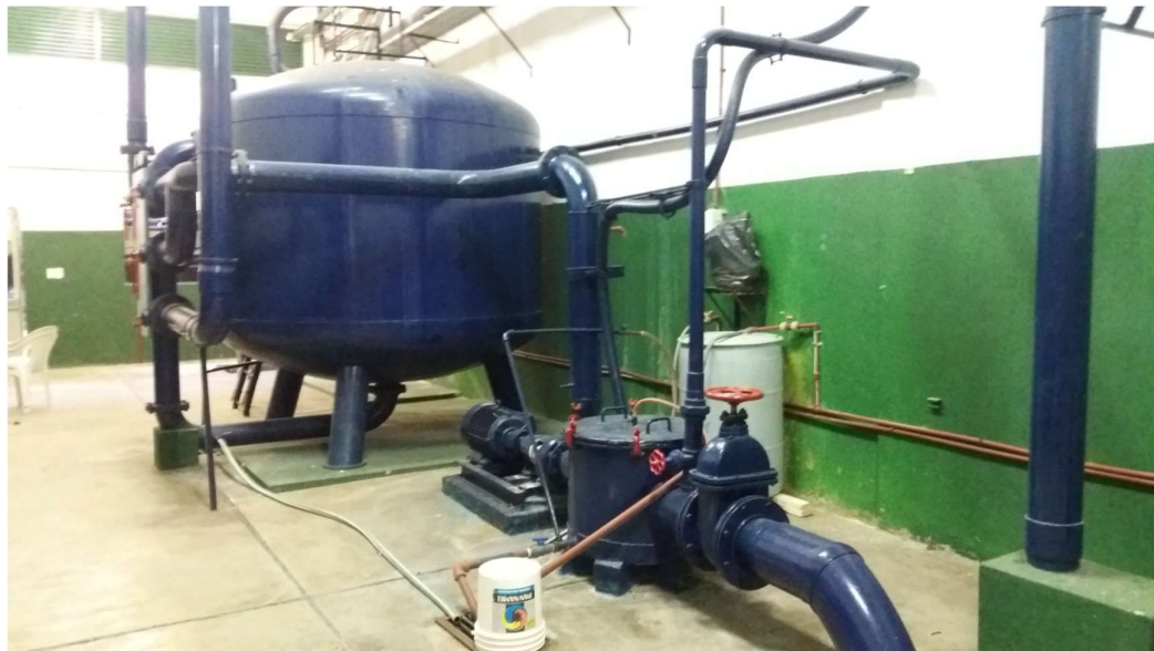
FILTROS DE PILETA DE SALTOS