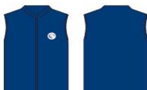
Chaleco polar azul Marino