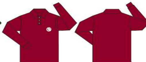
Chomba manga larga bordó