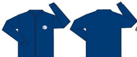
Campera polar azul Marino