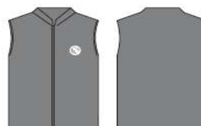
Chaleco polar gris Topo