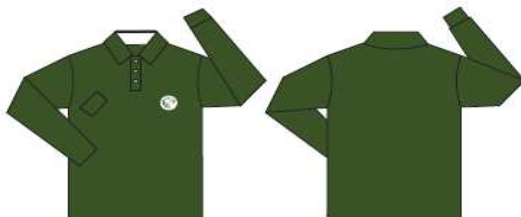
Chomba manga larga verde Inglés