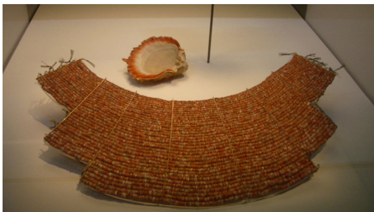
Pectoral de la cultura Mochica (100 a.C. – 850 d.C.) con Spondylus o “Mullu”.

“Según algunos cronistas españoles, para los nativos el mullu era más cotizado que el oro y las piedras preciosas y la demanda de la élite incaica era permanente y muy abundante. Tal demanda debió promover un tráfico muy importante de los mercaderes chinchanos hasta Puerto Viejo en Ecuador y luego una circulación terrestre tierra adentro para efectuar los intercambios”. 1