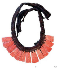
Collar masculino con Spondylus. Perteneciente a las ofrendas de las Momias de Llullaillaco. Museo Arqueológico de Alta Montaña. Salta.

En esta región, crearon además un taller que fabricaba objetos del preciado material con el fin de abastecer a la toda la aristocracia Inca.