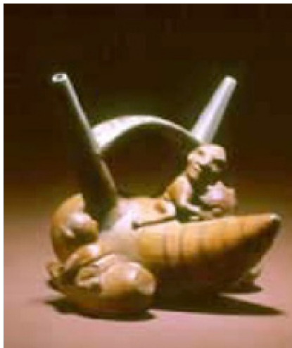
Representación de un buzo sujetando un Spondylus sobre un caballito de totora.

Su extracción del océano en el golfo de Guayaquil, era realizada por un nadador avezado que se ataba una cuerda a la cintura de la cual pendía una pesada piedra y así permanecía en las profundidades mientras visualizaba el bivalvo. Contaba para ello con el apoyo de otros pescadores que desde una embarcación lo sujetaban de la cuerda a fin de que su tarea discurriera sin riesgo de vida.