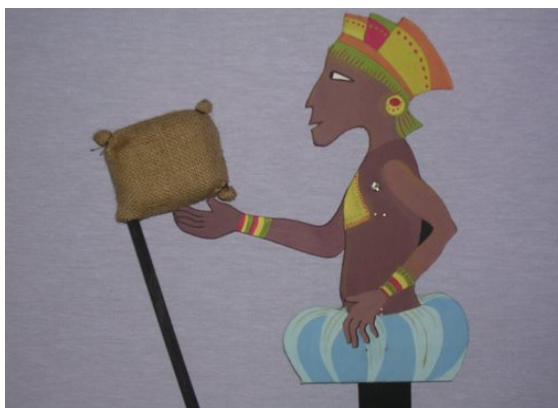
Personajes de superficie plana.