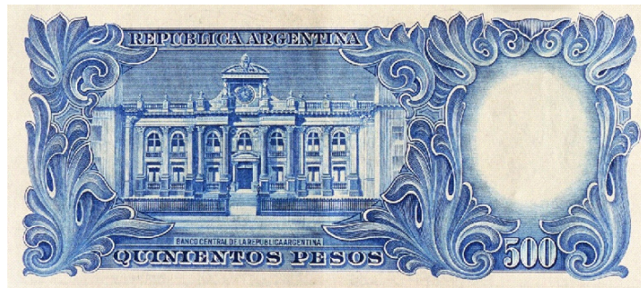
Frente del edificio del Banco Central en el billete de 500 m$n de 1944.

El Banco Central de la República Argentina se creó en 1935, durante la presidencia del General Agustín P. Justo, sobre la base de la Caja de Conversión y el Crédito Público Nacional.