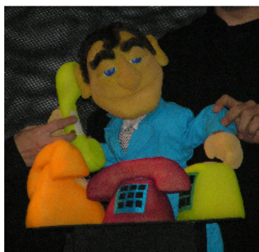
El Señor Banco Central.

El Señor Banco Central: uno de los protagonistas de la obra, cumple la función de héroe y está personificado como un hombre joven, activo y responsable.