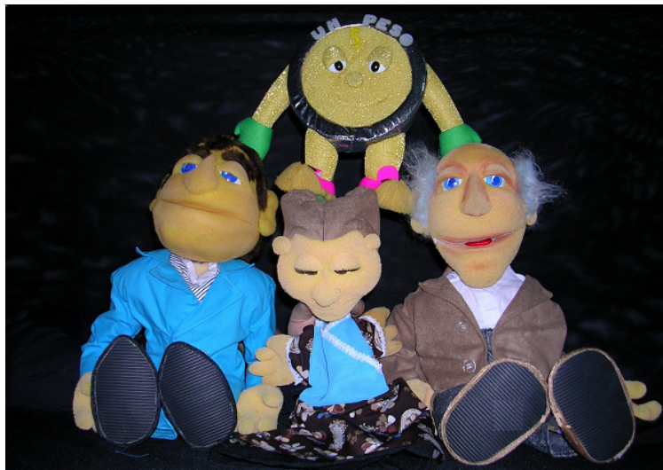
Moneda de 1 peso, Sr. Banco Central, Sra. Casa de Moneda y Abuelo.

Podemos destacar el mejoramiento de los recursos técnicos que esta nueva obra respecto de la anterior, en donde abundan los elementos de iluminación y sonido. En cuanto a los efectos lumínicos, además de la luz cenital que acompaña a los personajes protagonistas, se han incorporado cuadros de teatro de siluetas de sombras que mantienen la atención del público infantil. También se han mejorado las canciones y la música de fondo que acompaña a las escenas de acuerdo a cada situación. Se intensifican los sonidos musicales en las partes centrales de la obra y se eligieron ritmos autóctonos para las canciones que presentan a los personajes principales como el tango, la zamba y la cumbia.