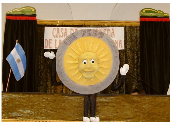
Obra de teatro de títeres del grupo La Estopa

Se le había encomendado al grupo de teatro “La Estopa” la