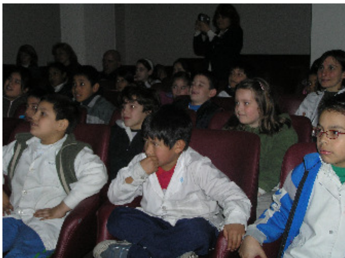
Público infantil presenciando una función.

Quisimos analizar a lo largo de nuestro trabajo como fueron nuestras experiencias con relación a las estrategias docentes y actividades para transmitir conocimientos y valores a los visitantes infantiles de nuestro Museo. La obra de teatro de títeres diseñada como una de las actividades más efectivas para llevar a los más chicos de los estudiantes se ha mejorado con la renovación del guión teatral, la incorporación de nuevos personajes y el mejoramiento de los recursos técnicos que la componen, para difundir la historia de la moneda argentina y la importancia del dinero en nuestra sociedad.