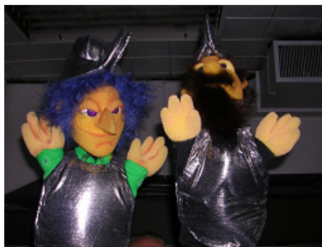
Títeres convencionales empuñados en forma de guante.

Los personajes están realizados con una indumentaria de acuerdo a los papeles que representan en la obra, con una amplia escala cromática para diferenciar a través de los colores las distintas vestimentas de cada uno de ellos. Las figuras, títeres y muñecos actúan en las diferentes escenas de la obra sobre cuadros que van cambiando la escenografía, de acuerdo a las ambientaciones históricas o actuales que se van desarrollando en la obra.