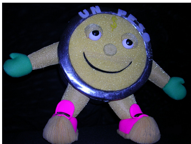
Personaje de la moneda bimetálica.