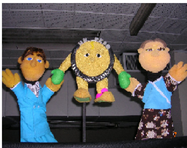
Escena de cierre de la obra de títeres