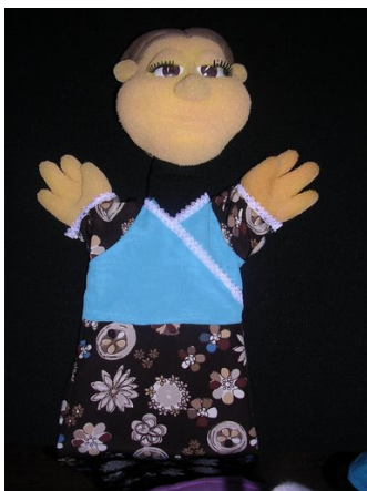
Señora Casa de Moneda.

La Señora Casa de Moneda: cumple la función de ayudante del héroe y está personificada como una mujer joven, aplicada y eficiente en su trabajo.