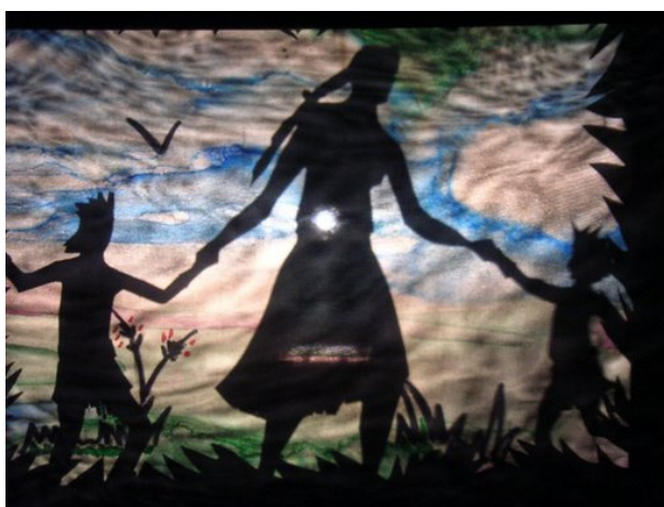
Escena del teatro de sombras.

La obra se halla estructurada en diferentes escenas. La escena inicial contiene a los personajes que presentarán las siguientes escenas dedicadas al pasado remoto: un cuadro de teatro de som-