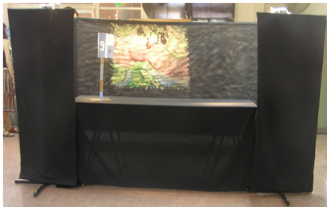
Detalle de la escenografía de la obra.

Los personajes están realizados con una indumentaria de acuerdo a los papeles que representan en la obra, con una amplia escala cromática para diferenciar a través de los colores las distintas vestimentas de cada uno de ellos. Las figuras, títeres y muñecos actúan en las diferentes escenas de la obra sobre cuadros que van cambiando la escenografía, de acuerdo a las ambientaciones históricas o actuales que se van desarrollando en la obra.