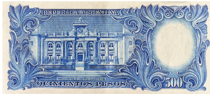
Frente del edificio del Banco Central en el billete de 500 m$n de 1944.

El Banco Central de la República Argentina se creó en 1935, durante la presidencia del General Agustín P. Justo, sobre la base de la Caja de Conversión y el Crédito Público Nacional.