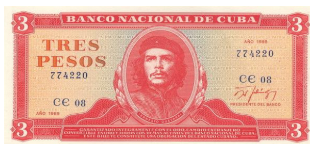
Anverso del billete cubano con imágenes alusivas al héroe cubano nacido en Argentina, emitido en 1983.

Continuando con el análisis numismático desde el punto de vista de la notafilia, en el año 1983 se emitió como complemento del circulante del papel moneda cubano, un ejemplar de valor “3 pesos” que en el anverso estaba ilustrado con el grabado del retrato de Ernesto “Che” Guevara, tomado de la famosa fotografía de Alberto Korda. En el reverso de este billete se colocó una ilustración sobre el mismo héroe cubano realizando la cosecha de caña de azúcar, para incentivar el trabajo voluntario. Este ejemplar con el raro valor de 3 pesos, tiene como color predominante al rojo, y en su anverso las imágenes y leyendas principales están impresas con la técnica calcográfica, mientras que en el reverso se empleó offset.