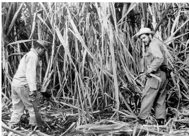
Ernesto Guevara realizando trabajo voluntario en una cosecha cubana.

En agosto de 1961 asistió a la ciudad de Punta del Este (República Oriental del Uruguay), como representante de Cuba en la conferencia del Consejo Interamericano Económico y Social (C.I.E.S.), que tuvo la apertura a cargo de Raúl Prebisch (5). Este viaje le permitió un retorno clandestino a la Argentina para tener una entrevista privada con el presidente Arturo Frondizi (6).