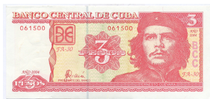
Anverso del último billete cubano emitido con el rostro de Ernesto “Che” Guevara.

Una última versión del billete de 3 pesos cubanos dedicado al “Che” Guevara, emitido recientemente por el Banco Central de Cuba, desplazó a la derecha del anverso el retrato principal, manteniendo el valor numérico en el centro y coloncado la marca de agua en el lateral izquierdo. Como los ejemplares anteriores, el reverso de esta tercera versión del billete, esta ilustrado con el héroe cubano en la zafra. Esta última versión respetó el color predominante rojo del ejemplar original del año 1983.