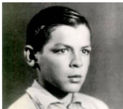
Retrato de Ernesto Guevara tomada en 1940.

Su primer año de vida transcurrió tranquilamente entre los viajes al yerbatal de su padre situado en la provincia de Misiones y la ciudad de Buenos Aires, hasta que a los dos años de edad se le declaró el asma. Por recomendación médica, la familia Guevara se mudó a la ciudad de Alta Gracia (provincia de Córdoba), donde el clima seco de las sierras alivió los ataques asmáticos de Ernesto. A causa de su enfermedad no pudo cursar regularmente los primeros años de la escuela, pero igualmente practicó asiduamente la lectura de libros y efectuó muchas amistades con otros niños. Sus padres, por su parte, trabaron amistades con refugiados de la Guerra Civil Española, cuyos relatos de exiliados republicanos fueron escuchados atentamente por Ernesto en su infancia.