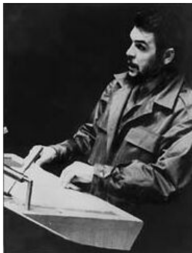
Ernesto “Che” Guevara disertando en 1964 en la Asamblea General de las Naciones Unidas.

“He nacido en la Argentina; no es un secreto para nadie. Soy cubano y también soy argentino y, si no se ofenden las ilustrísimas señorías de Latinoamérica, me siento tan patriota de Latinoamérica, de cualquier país de Latinoamérica, como el que más y, en el momento en que fuera necesario, estaría dispuesto a entregar mi vida por la liberación de cualquiera de los países de Latinoamérica, sin pedirle nada a nadie, sin exigir nada, sin explotar a nadie.” (Fragmento del discurso brinda-