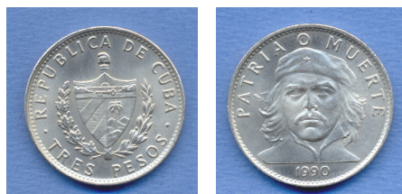
Anverso y reverso de la moneda de níquel emitida como circulante cubano con el retrato de Ernesto “Che” Guevara.