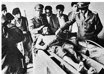
Fotografía tomada durante la exhibición del cadáver del “Che” Guevara, efectuada por las autoridades bolivianas.

fusilarlo sin ninguna instancia judicial y en horas del medio día el “Che” fue asesinado. Su cadáver y los de sus compañeros fueron trasladados hasta la localidad vecina de Vallegrande, donde fueron exhibidos a los pobladores y periodistas para dar pruebas contundentes de la eliminación de la guerrilla y finalizar con la imagen mítica del “Che” como revolucionario.