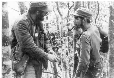
Fidel Castro y Ernesto “Che” Guevara durante la campaña revolucionaria de Cuba.

El 25 de noviembre de 1956, luego de un intenso entrenamiento en tácticas de guerrilla impartido por un antiguo soldado republicano que había participado de la Guerra Civil Española, Ernesto zarpó de la costa mexicana en calidad de médico junto a 82 hombres del “Movimiento 26 de Julio” en el yate “Granma” rumbo a la isla caribeña de Cuba.