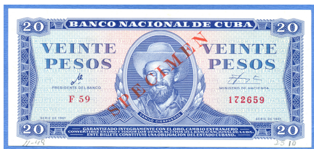
Anverso de un billete cubano con la firma de Ernesto “Che” Guevara como presidente del Banco Nacional de Cuba.

Continuando con el análisis numismático desde el punto de vista de la notafilia, en el año 1983 se emitió como complemento del circulante del papel moneda cubano, un ejemplar de valor “3 pesos” que en el anverso estaba ilustrado con el grabado del retrato de Ernesto “Che” Guevara, tomado de la famosa fotografía de Alberto Korda. En el reverso de este billete se colocó una ilustración sobre el mismo héroe cubano realizando la cosecha de caña de azúcar, para incentivar el trabajo voluntario. Este ejemplar con el raro valor de 3 pesos, tiene como color predominante al rojo, y en su anverso las imágenes y leyendas principales están impresas con la técnica calcográfica, mientras que en el reverso se empleó offset.