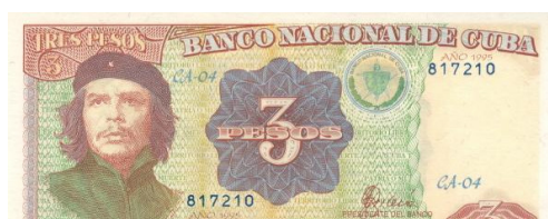
Anverso del billete emitido en 1995.

En 1995, se efectuó una segunda versión del billete de 3 pesos dedicada a homenajear al Comandante Guevara, con algunas modificaciones. Entre los cambios efectuados, se encuentra una alteración de la escala cromática que incluyó al color verde, combinado con el rojo. El retrato principal del anverso está colocado a la izquierda, mientras que en el centro se colocó el valor numérico y se reservó el lateral derecho para la marca de agua. En el reverso de este ejemplar figura una ilustración similar al anterior, donde el héroe cubano se encuentra cosechando la caña de azúcar, cultivo protagonista de la economía de la isla.