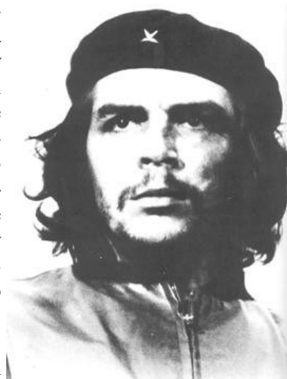
Famoso retrato de Ernesto “Che” Guevara realizado por el fotógrafo Alberto Korda.

Un antiguo proverbio atribuido a los chinos dice que “una imagen vale por mil palabras” y así lo comprendieron y aplicaron las distintas formas de poder que gobernaron las sociedades humanas. La numismática es un claro ejemplo de esta modalidad política, basta recordar la innumerable cantidad de retratos de monarcas y gobernantes que ilustran las monedas y billetes de todo el mundo desde el origen del dinero.