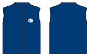
Chaleco polar azul Marino