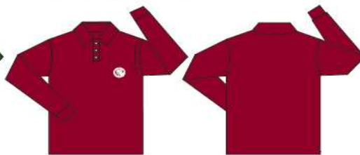
Chomba manga larga bordó