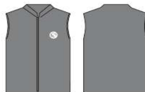
Chaleco polar gris Topo