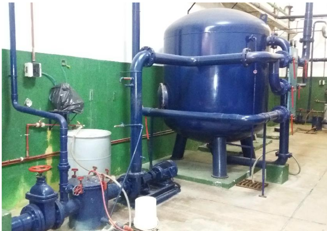
FILTROS DE PILETA DE NADADORES