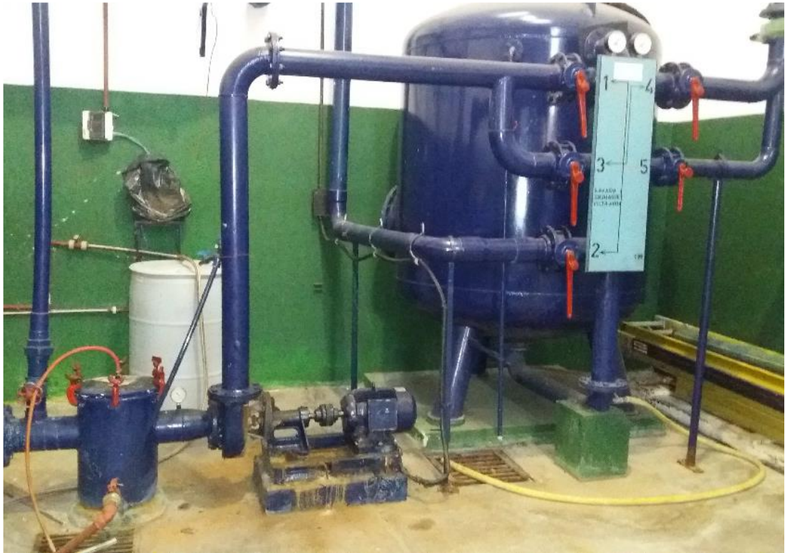
FILTRO DE PILETA DE NO NADADORES

Componentes de reguladores de caudal de agua filtrada de la pileta de saltos, a renovar.