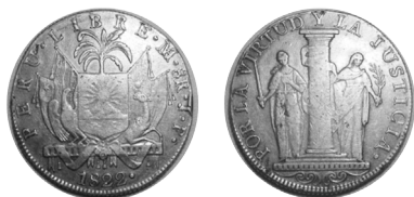
Moneda peruana de plata acuñada en 1822, conocida como “Peso de San Martín”.

En el Hall de la planta baja, se expone la muestra titulada “Héroes y Heroínas de la Patria Grande” donde se exhiben piezas alusivas a las luchas que los pueblos latinoamericanos vienen desarrollando, desde el siglo XIX hasta el presente, por su independencia definitiva.