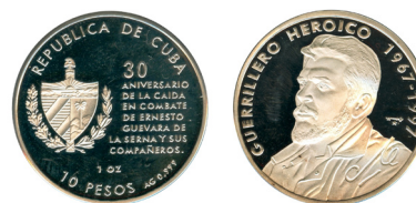
Moneda acuñada en plata en 1997, con el retrato de Ernesto Guevara.

El siglo XX fue vibrante en la lucha de los pueblos americanos para conseguir la independencia económica de la Patria Grande. La Revolución Cubana de 1959 fue un caso central. Otro proceso de liberación nacional fue el peronismo industrializador, redistributivo y de ampliación de derechos, cuyas bases sociales de sustentación fueron quebradas por el Terrorismo de Estado de la dictadura cívico-militar.