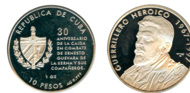
Moneda acuñada en plata en 1997, con el retrato de Ernesto Guevara.

El siglo XX fue vibrante en la lucha de los pueblos americanos para conseguir la independencia económica de la Patria Grande. La Revolución Cubana de 1959 fue un caso central. Otro proceso de liberación nacional fue el peronismo industrializador, redistributivo y de ampliación de derechos, cuyas bases sociales de sustentación fueron quebradas por el Terrorismo de Estado de la dictadura cívico-militar.