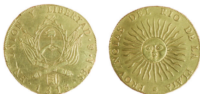
Primera Moneda Patria de oro acuñada en Potosí en 1813.

En el primer piso de su sede se podrá recorrer nuestra colección permanente de historia monetaria argentina, distribuida en seis salas con valiosas piezas catalogadas desde los pueblos originarios y la etapa colonial hasta las últimas emisiones numismáticas del Banco Central.