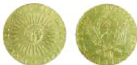
Anverso y reverso de la Onza Patria de 1813.

La exhibición reseña la historia del circulante argentino desde la época colonial hasta nuestros días. Se exponen monedas macuquinas que circularon en el virreinato hispanoamericano durante los siglos XVI al XVIII, las primeras monedas patrias de 1813, las emisiones monetarias de las provincias de La Rioja, Córdoba y Buenos Aires de la primera mitad del siglo XIX, y las piezas acuñadas en 1881 con el nacimiento del "Peso Moneda Nacional".