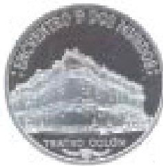
Reverso de la moneda de plata de la VI serie iberoamericana de 2005, con el Teatro Colón de Buenos Aires.

Finalmente, se exhiben también monedas de carácter numismático que destacan valores sociales y culturales como las monedas que conforman las series iberoamericanas, y aquellas piezas que conmemoran acontecimientos históricos de nuestro país.