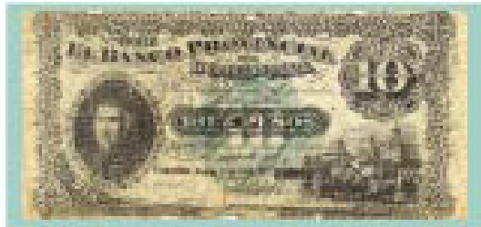
Billete de 10 pesos del Banco Provincial de Córdoba de 1881.

Especialmente se ha destacado el motivo arquitectónico de la Catedral de Córdoba con su pórtico neoclásico y sus cúpulas y torres barrocas.