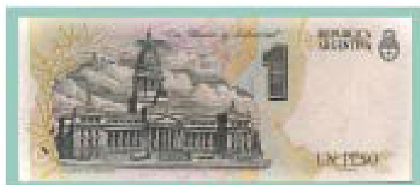
Reverso del billete de 1 peso convertible de 1992.

Completa esta exhibición una selección de monedas y billetes de nuestro país que tienen como tema motivos de la arquitectura nacional en sus diseños, clasificados cronológicamente en tres etapas consecutivas: colonial (siglo XVIII); independiente (siglo XIX) y moderna (siglo XX). De esta manera se ha valorado el importantísimo patrimonio arquitectónico argentino, que forma parte de nuestro acervo cultural que caracteriza nuestra identidad nacional.