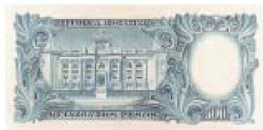
Frente del edificio del Banco Central en el billete de 500 pesos de 1944.

El Banco Central tiene como facultad exclusiva la emisión de la moneda otorgada por el Honorable Congreso de la Nación. Además regula la actividad bancaria, es agente financiero del Estado y custodio de las reservas del país. "Es misión primaria y fundamental del Banco Central de la República Argentina preservar el valor de la moneda" (Art. 3, de la ley 24,144)