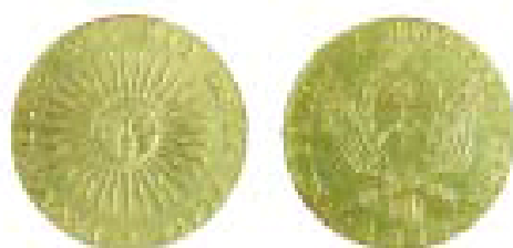
Anverso y reverso de la Onza Patria de 1813.

La exhibición reseña la historia del circulante argentino desde la época colonial hasta nuestros días. Se exponen monedas macuquinas que circularon en el virreinato hispanoamericano durante los siglos XVI al XVIII, las primeras monedas patrias de 1813, las emisiones monetarias de las provincias de La Rioja, Córdoba y Buenos Aires de la primera mitad del siglo XIX, y las piezas acuñadas en 1881 con el nacimiento del "Peso Moneda Nacional".