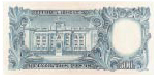
Frente del edificio del Banco Central en el billete de 500 pesos de 1944.

El Banco Central tiene como facultad exclusiva la emisión de la moneda otorgada por el Honorable Congreso de la Nación. Además regula la actividad bancaria, es agente financiero del Estado y custodio de las reservas del país. "Es misión primaria y fundamental del Banco Central de la República Argentina preservar el valor de la moneda" (Art. 3, de la ley 24,144)