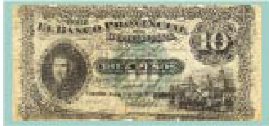
Billete de 10 pesos del Banco Provincial de Córdoba de 1881.

Especialmente se ha destacado el motivo arquitectónico de la Catedral de Córdoba con su pórtico neoclásico y sus cúpulas y torres barrocas.