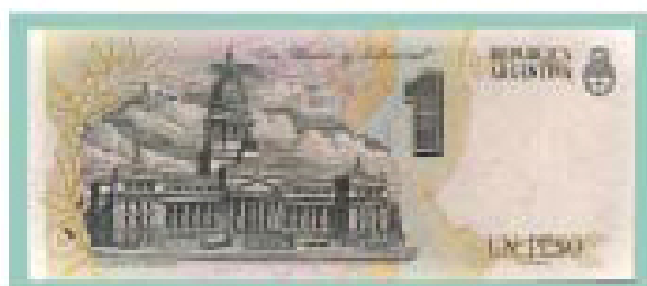
Reverso del billete de 1 peso convertible de 1992.

Completa esta exhibición una selección de monedas y billetes de nuestro país que tienen como tema motivos de la arquitectura nacional en sus diseños, clasificados cronológicamente en tres etapas consecutivas: colonial (siglo XVIII); independiente (siglo XIX) y moderna (siglo XX). De esta manera se ha valorado el importantísimo patrimonio arquitectónico argentino, que forma parte de nuestro acervo cultural que caracteriza nuestra identidad nacional.