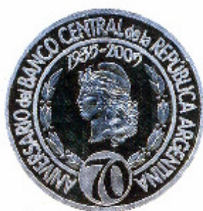
Anverso y reverso de la moneda por el 70 aniversario del Banco Central de la República Argentina

Completan esta exposición las emisiones especiales que en los últimos años se han emitido para conmemorar acontecimientos históricos o destacados valores culturales, que podrán ser apreciados en las vitrinas.