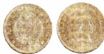
Anverso y Reverso de moneda "Argentino de Oro"

También forma parte de esta muestra una síntesis de historia monetaria argentina desde las monedas coloniales españolas hasta el circulante actual, emitido por el Banco Central de la República Argentina, describi-