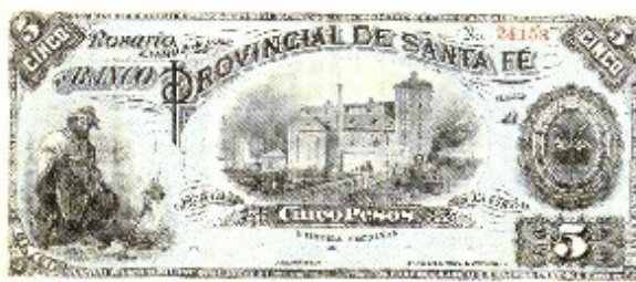
Anverso billete 5 pesos del Banco de la Provincia de Santa Fe, 1882.

La temática de la muestra se encuentra dirigida a homenajear a los inmigrantes europeos que en 1856 fundaron la Colonia Esperanza en la provincia de Santa Fe. El emprendimiento de colonos agrícolas proyectado por Aarón Castellanos con el gobernador Domingo Crespo, tuvo el merecido éxito debido al esfuerzo del trabajo de los inmigrantes europeos quienes en pocos años transformaron las tierras agrestes del norte provincial en un verdadero vergel de parcelas cultivadas. La proliferación de colonias agrícolas en Santa Fe cambió la economía nacional en la segunda mitad del siglo XIX, transformando a nuestro país en uno de los principales productores y exportadores de cereales.